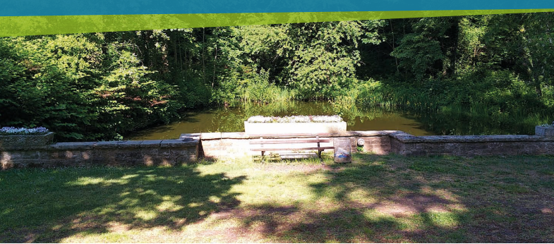
Gegenüber – auf der anderen Straßenseite befindet sich der